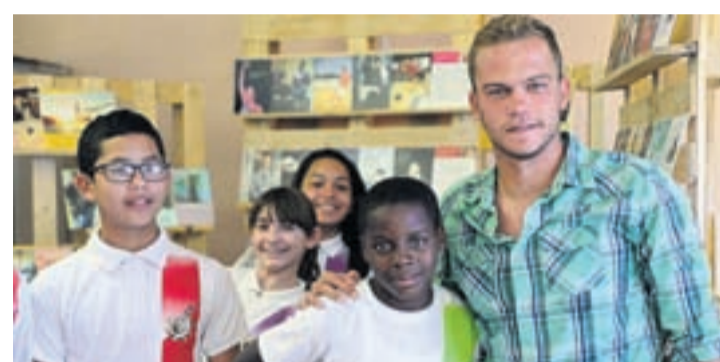
Biblioteca Nacional Aruba: